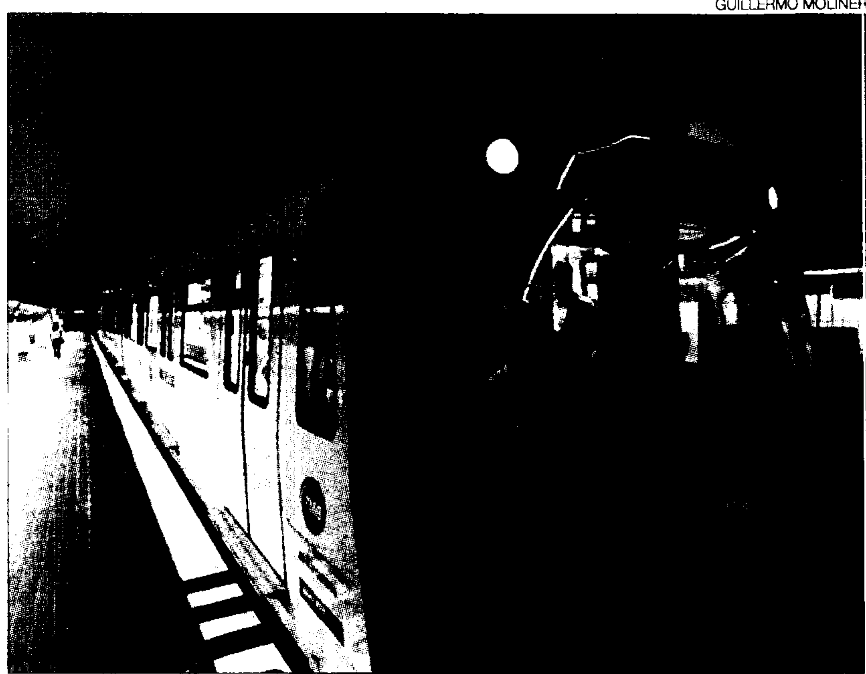
► Exterior de la primera de les unitats que renovaran la L-1, ahir.