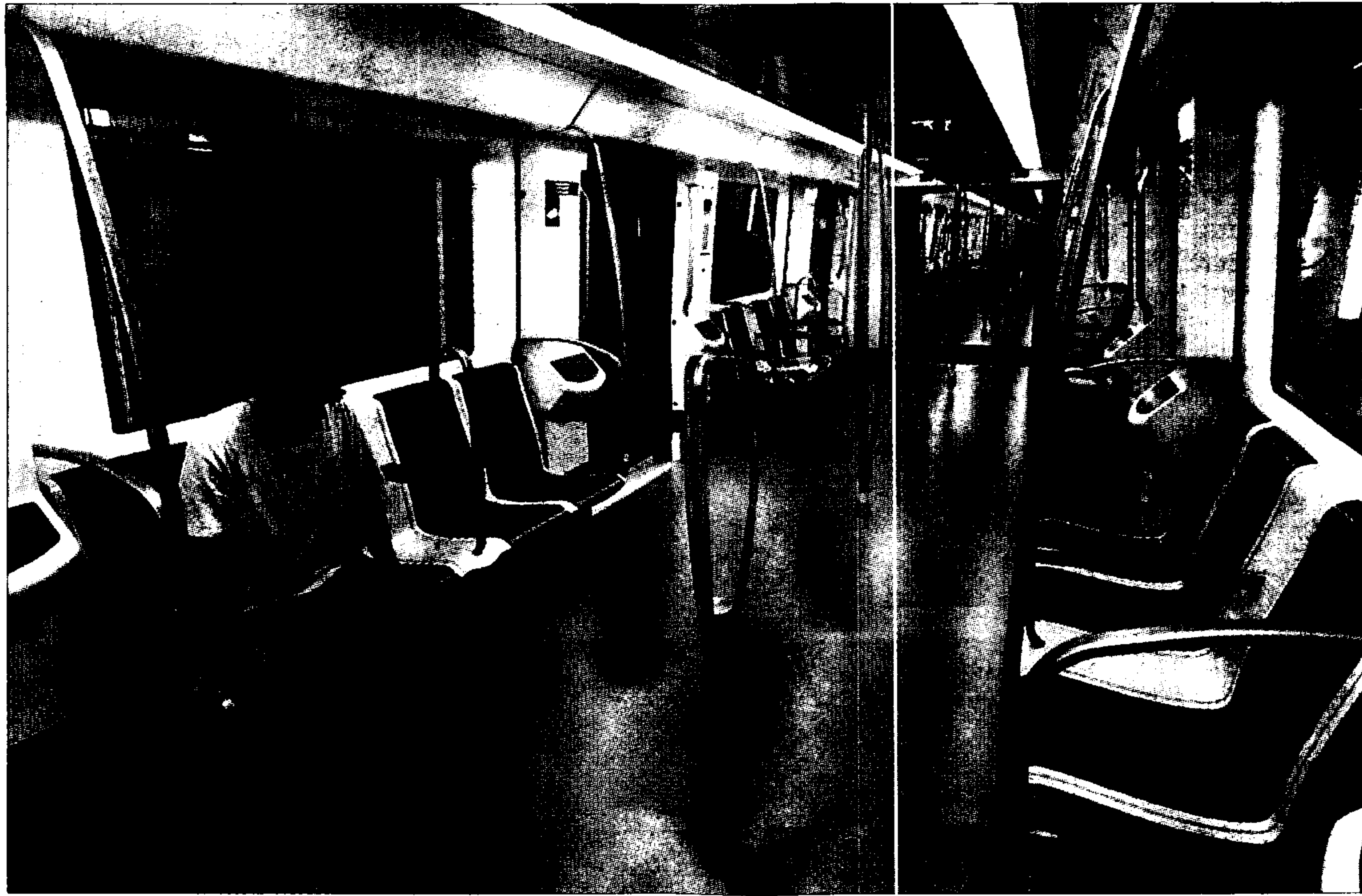
► Interior sense separació entre vagons del tren de la sèrie 6000 posat en servei a la L-1, ahir.

La sèrie 6000 no té separació entre vagons i els seients van enganxats als costats. L'espai útil creix així fins als 1.117 passatgers. L'interior és ampli i diàfan i el viatge, confortable, si bé en el trajecte inaugural Sagrera-Catalunya el tren va trontollar ahir perceptiblement en algun punt