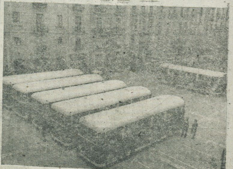
Las magníficas unidades, alineadas frente al Palacio Municipal y que fueron objeto de la admiración pública