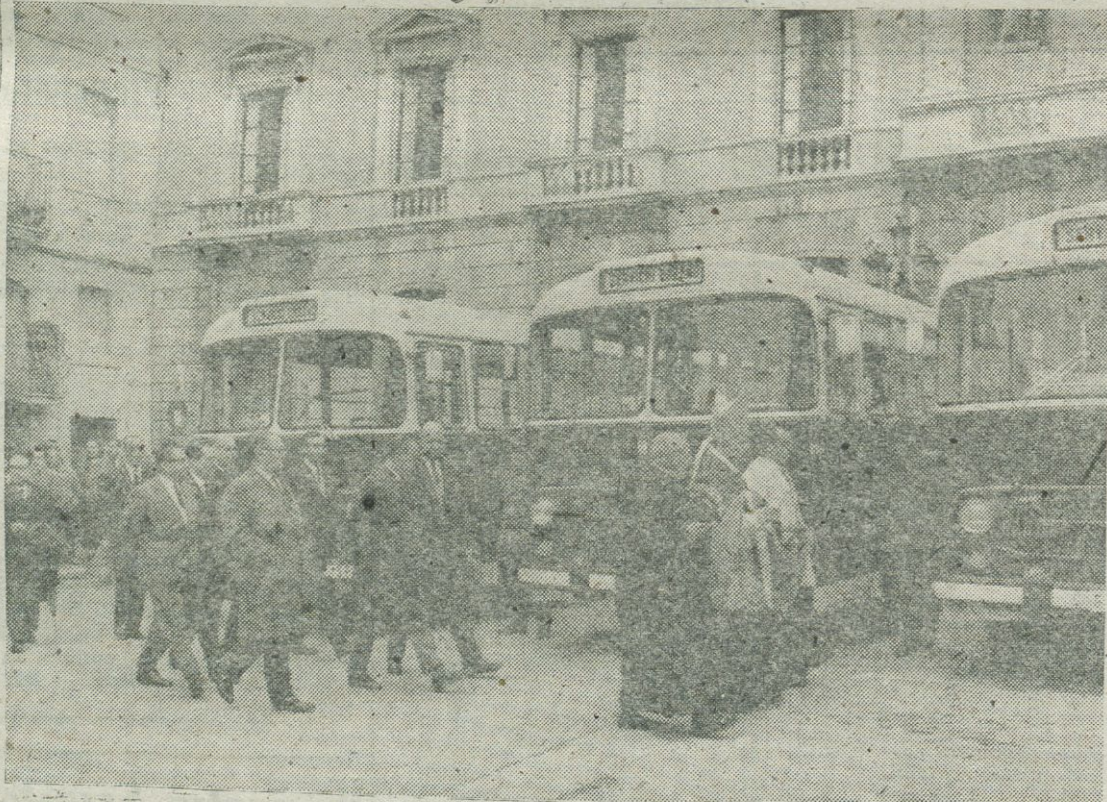
El Sr. Cardenal procediendo a la bendición de los nuevos autobuses acompañado del Gobernador Civil, Presidente de la Diputación, Alcalde de la Ciudad y Corporación Municipal

Con tal motivo, el pasado domingo, se concentraron seis unidades frente a las Casas Consistoriales, con el fin de hacer su presentación oficial ante las Primeras Autoridades tarraconenses y público en general. Perfectamente alineados, los flamantes «Pegaso Monotral», causaron la admiración de los tarraconenses, pues en su proyección se han tenido en cuenta las experiencias acumuladas en el servicio de transportes urbanos, ofreciendo una capacidad para setenta viajeros, cincuenta de los cuales podrán hacer los trayectos de ple, dada su escasa duración, mien-