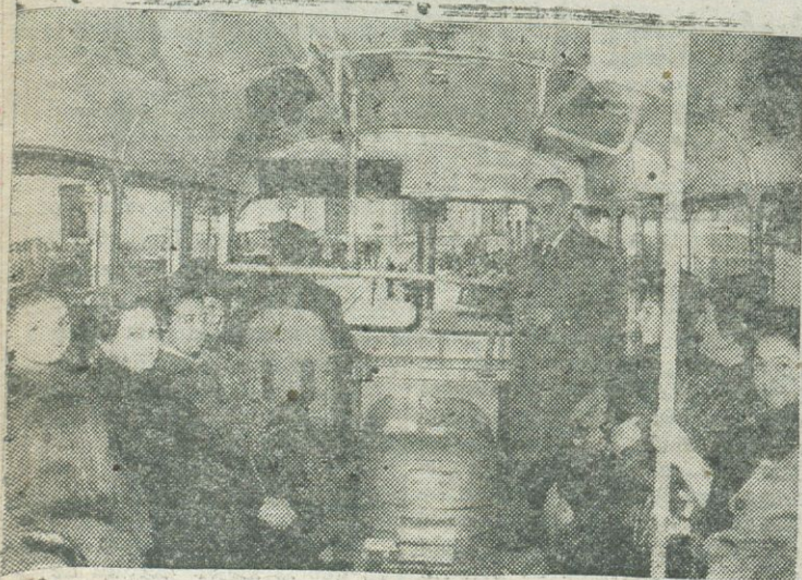
Las esposas de nuestras Autoridades en el interior de los autobuses durante el recorrido por la Plaza de José Antonio

(Pasa a la página diez)